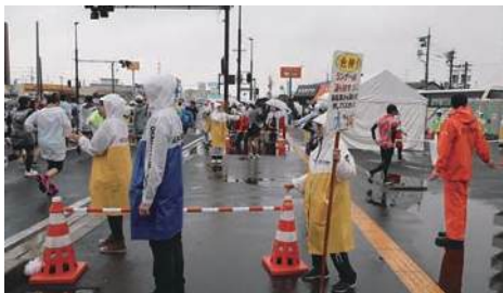
コース沿道 沿道整理 トイレ誘導

ランナーの手荷物返却、会場誘導・案内などを行います。ランナーサービスでは、完走後のランナーを笑顔で出迎えながら、フィニッシャータオルや完走メダルなどを手渡ししましょう。