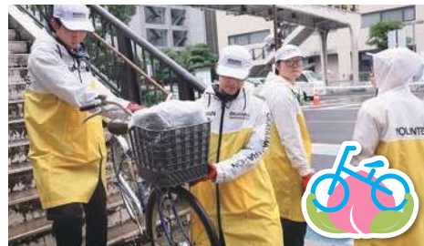
コース沿道 お運びボランティア

ランナーに安全に走ってもらうため、コース上への観衆の飛び出しや横断防止、ランナーの仮設トイレ誘導などを行います。