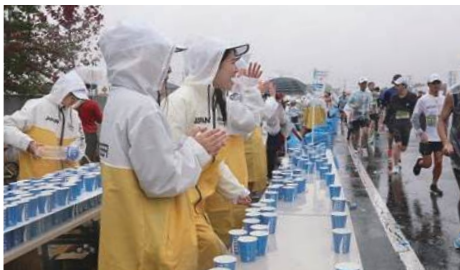
コース沿道 給水給食