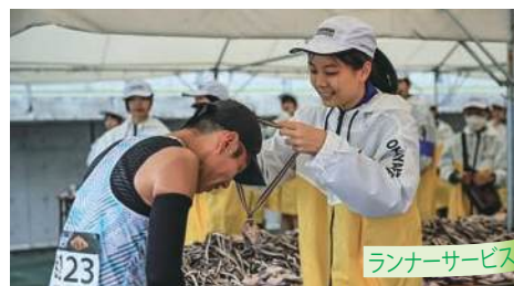
ランナーサービス