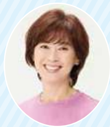
スペシャルアンバサダー 有森 裕子さん (岡山県出身)