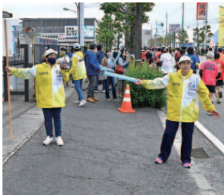
コース沿道 沿道整理 トイレ誘導

ランナーの手荷物返却、会場誘導・案内などを行います。ランナーサービスでは、完走後のランナーを笑顔で出迎えながら、フィニッシュタオルや完走メダルなどを手渡ししましょう。