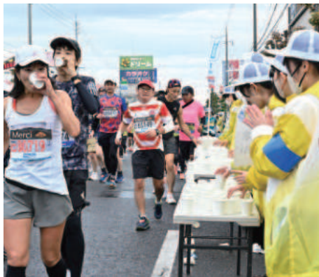
コース沿道 給水給食

給水所で水やスポーツドリンク、給食を提供します。長時間走り続けるランナーにとって欠かせない場所です。