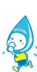
岡山市イメージキャラクター「ミコロ・ハコロ」