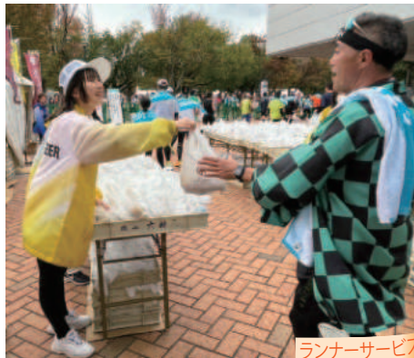
ランナーサービス