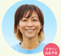
マラソン 出走予定 坂本 直子 さん (元天満屋)