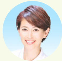
スペシャルアンバサダー 有森 裕子 さん (岡山県出身)